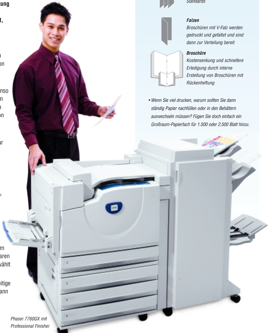
Phaser 7760GX mit Professional Finisher